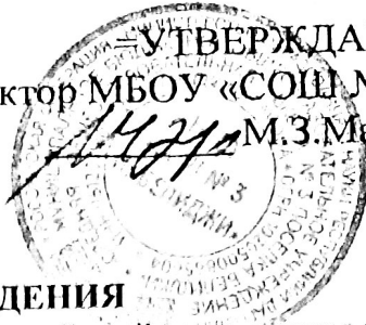
ГРАФИК ПРОВЕДЕНИЯ предметных олимпиад школьного этапа Всероссийской олимпиады школьников по общеобразовательным предметам в МБОУ «СОШ №3 п. Белиджи» в 2020-2021 учебном году